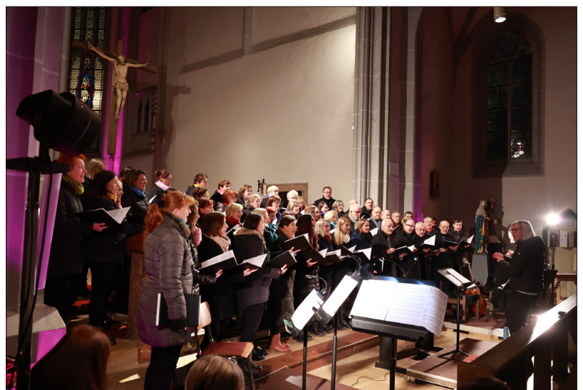
Mit dem Konzert „Veni, Emmanuel“ des Chor Haag wird der Musische Advent am Freitag, 13. Dezember, 19.00 Uhr in der Pfarrkirche feierlich eröffnet.

Traditionell wird am Samstag Abend um 19.00 Uhr die Sportlermesse in der Stadtpfarrkirche gefeiert. Und natürlich werden – wie jeden Tag im Advent – auch an diesem Wochenende die Fensterchen im Adventdorf geöffnet: am Freitag, Samstag und Sonntag jeweils um 17.00 Uhr. Am Samstag findet zudem ein Perchtenlauf der Haager Schlossteufel in der Bahnhofstraße (18.30 bis 20.00 Uhr) statt.