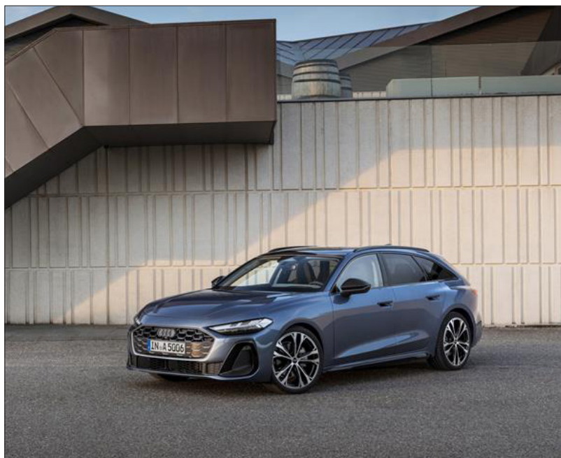
Den neuen Audi A5 Avant in der Mobilitätswelt in Haag hautnah bei einer Probefahrt entdecken.

Haag: +43 7434 42270 haag.info@senker.at www.senker.at