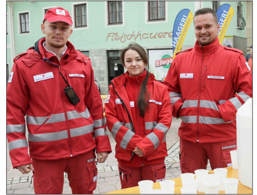
Links: der Haager Hauptplatz verwandelte sich in eine Sportarena. Oben: Das Rote Kreuz Haag sorgte für Sicherheit entlang der Strecke.