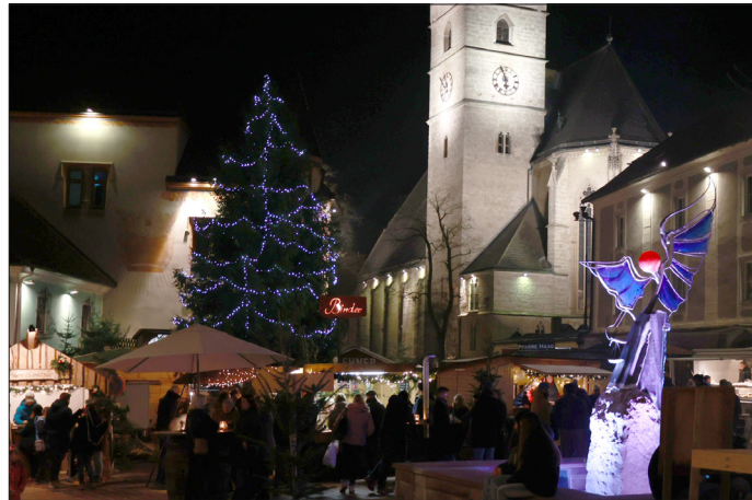
Der Musische Advent findet am 3. Adventwochenende am Haager Hauptplatz und in den umliegenden Gebäuden statt.

34. MUSISCHER ADVENT / Von 13. bis 15. Dezember findet der traditionelle Musische Advent am Haager Hauptplatz und in den umliegenden Gebäuden statt.