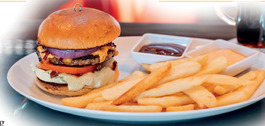
Cheesburger mit Steakhouse-Pommes.

Das neue Lokal richtet sich an Familien, Pensionisten, Arbeiter und Büroleute gleichermaßen und bietet von Montag bis Freitag