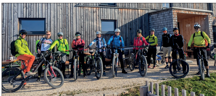
Die Mitglieder des RC Haag fahren bei der Hüttentour dieses Mal auf den Schoberstein.

Nach einem gemütlichen Abend erwartete die Radler ein sonniger Morgen und ein Frühstück draußen auf der Terrasse. Die Rückfahrt vom Sonnenschein in den Nebel auf dem Radweg über Steyr radelten alle gemeinsam.