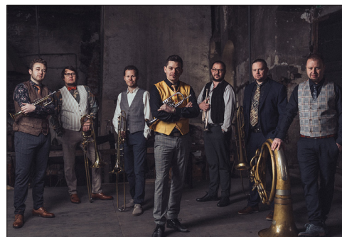
Quetschwork-Family meets Blechhauf'n am 20. Juli 2025, 20.15 Uhr.