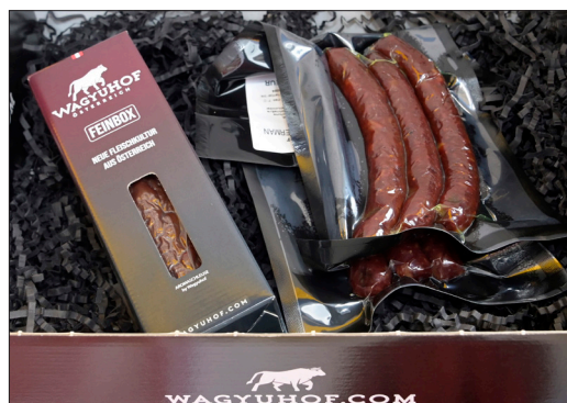
Oben rechts: nach den Rennen wurde die Raiffeisen-Hüpfburg von den Kindern in Beschlag genommen. Links und ganz links: Danke an unsere Sponsoren – Spar Markt Ringseis spendete zwei große Geschenkkörbe für die schnellsten Zeiten (weiblich und männlich), Wagyuhof stellte rund zwanzig leckere Geschenk-Boxen für die Gewinner zur Verfügung.